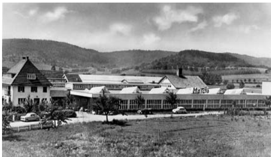
MAICO-Werke GmbH. Pfäffingen-Tübingen

Opgericht in 1926 en bestuurd door de familie Maisch (en co ) totdat de zaak in 1983 failliet ging. Sindsdien leidt het merk MAICO een marginaal bestaan. Naast Duitsland en Nederland, bestaat er ook in België, Frankrijk en Engeland een levendige MAICO -oldtimer gemeenschap. In de USA en Canada zijn met name grote groepen MAICO -oldtimer crossers actief.